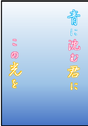
「青に沈む君にこの光を」 汐見夏衛 他/スターツ出版