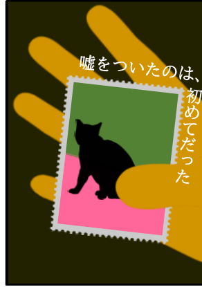
「嘘をついたのは、初めてだった」 青羽悠 他/講談社