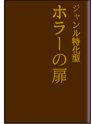
「ジャンル特化型 ホラーの扉」 澤村伊智 他/河出書房新社